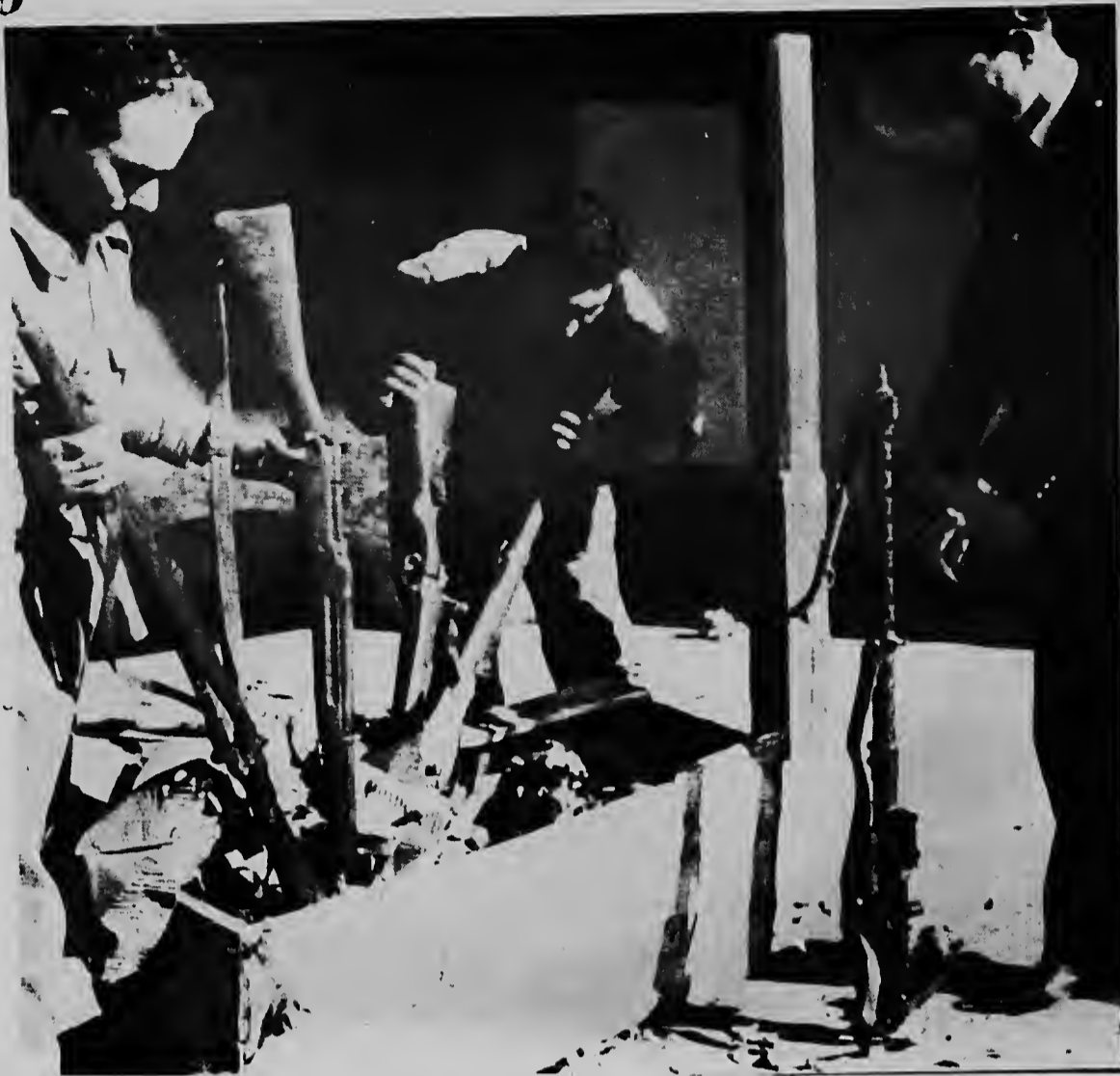
Aki nos ta mira Cypriotanan Turco mustrando un coleccion di arma destina pa e Cypriotanan Griego. E armanan a jega cu barcu pa e isla como material grafico.